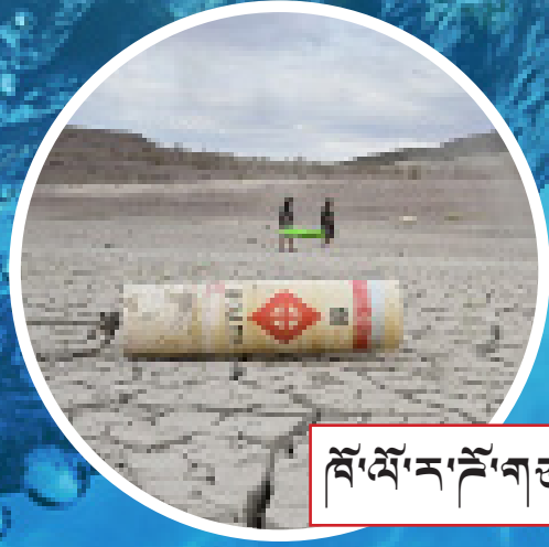
ལོ་ལོ་ར་རོ་གཙང་བོ།

ཨ་རི་ལོ་ལོ་ར་རོ་ (Colorado) གཙང་བོ་ བཀག་ནས་ཨེས་རྗེ་(Lake Mead) མཚོ་མོ་ འབྲིལ་ཡོད་པ་དེ་སྐྱམ་རྗེས་མཚོ་གྲུལ་དུ་ཕི་ལྷོ་ལྷོ་ ཡོ་བརྟེན། རེ་མ་ཡོ་གཅིག་གིས་ལོ་ཉི་ལྱའི་གོང་གི་ ལྗོངས་ལོ་ལོ་ལོ་ལོ་གཙོ་བོ་བྱུང་།