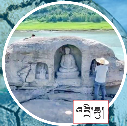
འབྲི་རྩུ།

འབྲི་རྩུ་སྐྱམ་སྟེ་རྩུ་ལི་མཚོ་ཚད་དེ་དམའ་མོང་རྗེས་འབྲི་ རྩུ་ལི་བཟུང་རྩུ་ལི་ཡོད་པའི་རྩུ་ལི་ལྷོ་ལྷོ་ཆེན་ (重庆) ས་ཆ་ནས་ལོ་༦༠༠ ཅམ་གྱི་ལོ་རྒྱུས་ཡོད་ པའི་ནང་པའི་རྩོ་བརྗོད་སྐུ་བརྟན་གསུམ་བྱི་ལ་ཐོན།